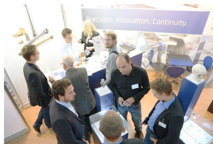
Unser Messestand am 2. World Medtech Forum lockte zahlreiche Besucher an und führte zu vielen interessanten Gesprächen.